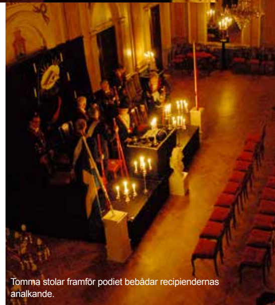
Tomma stolar framför podiet bebädar recipiendernas analkande.

Måltidskalaset blev en av de vackraste som vi upplevt. Ett runt honnörsbord var placerat i mitten och sedan hade Providören Roger Blomquist placerat "Ljusstrålar" i form av bord som utgick från "solen". Kandelabrarna var magnifika i denna dukning. Det är i ögonblick