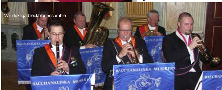
Vår duktiga bleckbläsensamble.