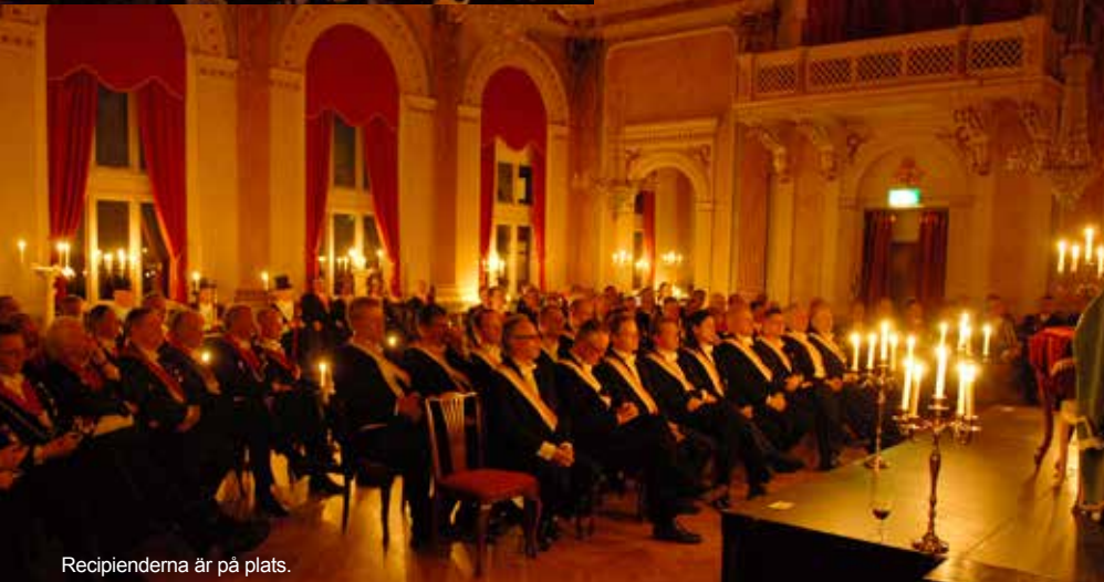
Recipienderna är på plats.

saker, att komma på nya saker. En del har förmåga att bevara och samla, att föra det gamla vidare. En del har lätt för att roa och en del är bra på att lyssna. Alla finns vi här för att lysa upp vår tillvaro. Ingen är utan värde. Alla bär på ett ljus. Därför bör vi också visa alla dessa strålande stjärnor och talanger respekt när dom lyser upp vår tillvaro på olika sätt. Den Fjärde Graden blev en oförglömlig kväll på många sätt tack vare alla er som kom och visade respekt för våra traditioner. Ibland känns ETT år väldigt långt när man längtar efter nåt så fint som den Fjärde Graden år 2008.