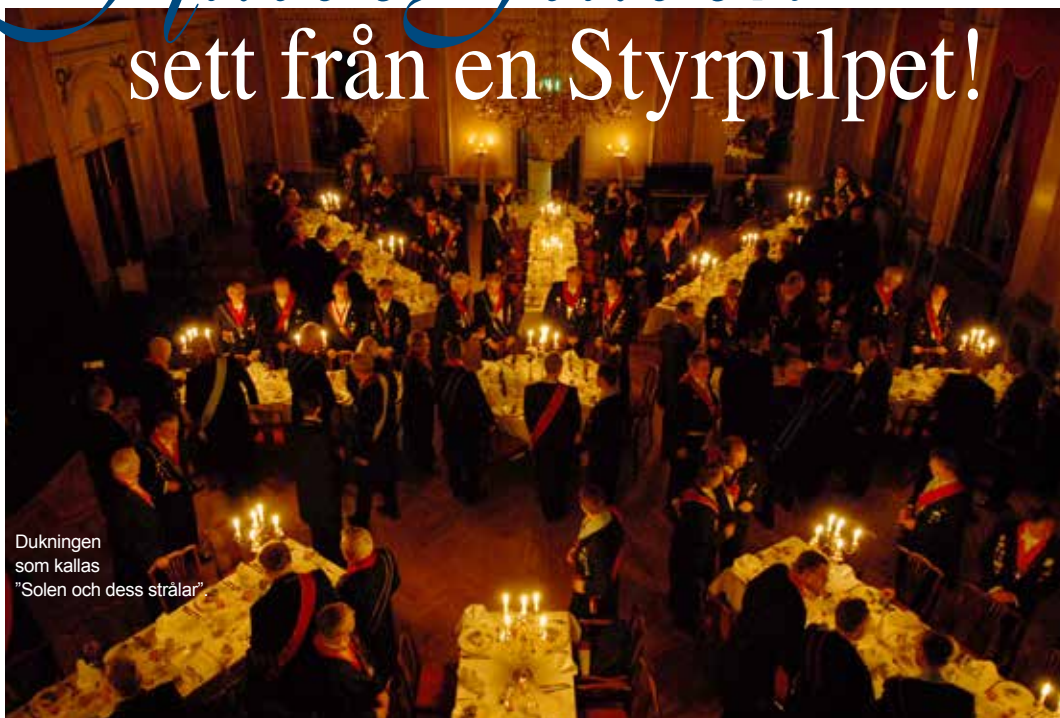
Dukningen som kallas "Solen och dess strålar"

I Jönköping lystes vår stad upp av ett antal bränder som ödelade stora delar av bebyggelsen. Det bodde knappt 3000 invånare i Jönköping på 1770-talet som kippade efter andan på grund av epidemier som kolera och pest medan man i Stockholm firade den seende graden