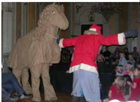
Hästen och tomten inför tindrande barnaögon på Julfesten 6 januari 2007.

Sällan har väl fler tindrande barnaögon setts än när tomten dyker upp under balkongen. Eller när den slanka hästen kommer strax därefter. Dramaturgin når peripeti när hästen visar sig kunna såväl räkna som låta sitt vatten. Allt till ackompanjemang av jublande barnaröster och applåderande föräldrar och far- och morföräldrar.