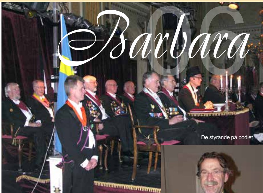
De styrande på podiet.