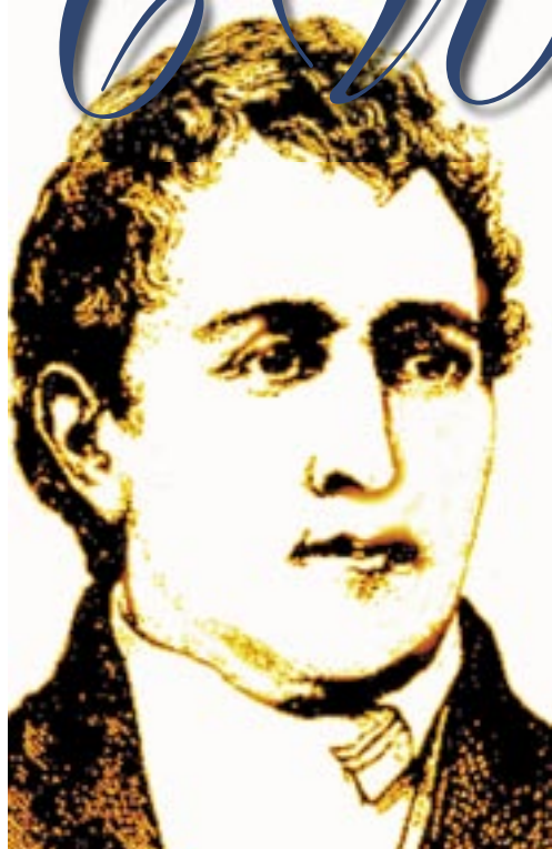
Carl Wilhelm Scheele.