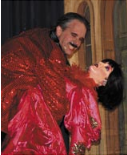
"Dansa min docka – trots att du är tung"...