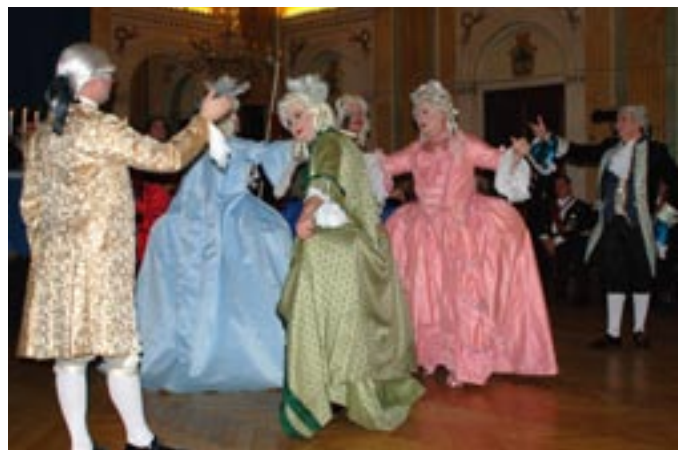
Galanta PB-bröder i kvinnlig rokokotappning á la Göteborg 2009.