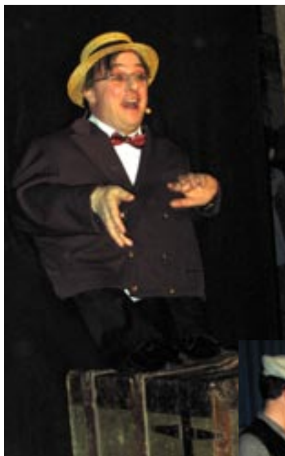
"United States Of Amööörka..." Ett göteborgskt inslag som fick stående ovationer.