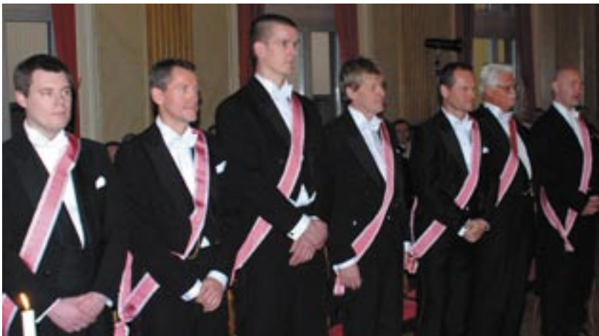
Andra gradens Klare Och Befallande Överkommendörer.