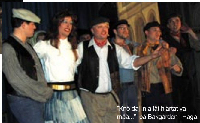
"Knö daj in å låt hjärtat va mää..." på Bakgården i Haga.