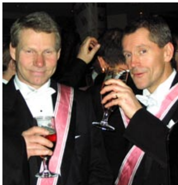
Även nykläckta Klare Och Befallande Överkommendörer tager sig understundom en pilsner.

fylligare i smaken, ofta med mindre kolsyra än i lagerölen. Ale har i regel en brun eller lite rödaktig färgton. En ale blir oftast bättre om den lagras.