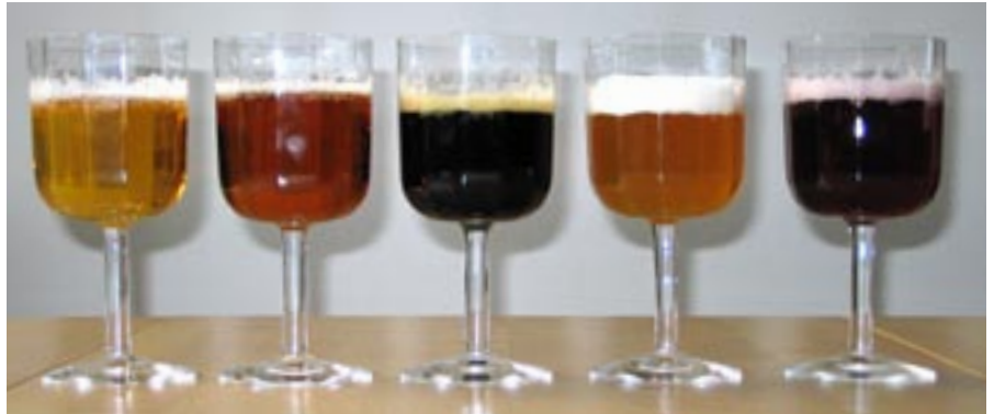
En öl kan se ut på många sätt. Fr v står lageröl, ale, porter, veteöl och körsbärsöl

Lagerölet är det klart dominerande i Sverige, Danmark, Tyskland och Tjeckien.