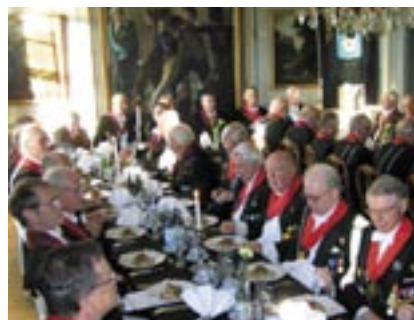
Måltidskalaset i den Gustavianska matsalen.