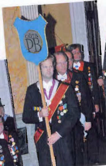
Gästande Styrande från systerlogerna i procession – Sundsvall, Vänersborg, Göta och Malmö.