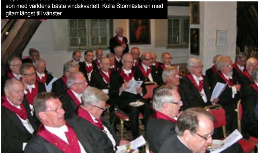
Allsång på vinden – orepererat och starkt men ändå allsång...