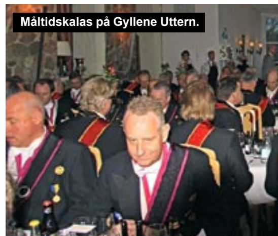
Måltidskalas på Gyllene Uttern.