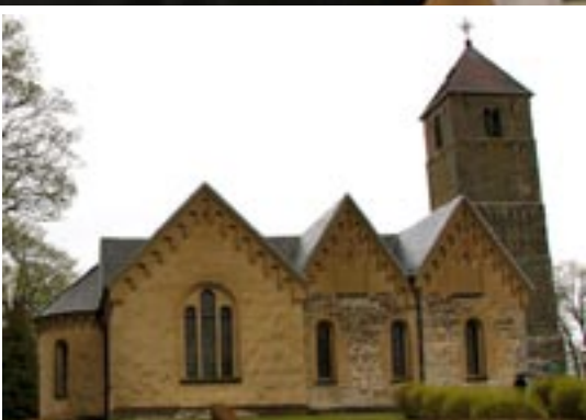
Heda medeltidskyrka med anor från 1140