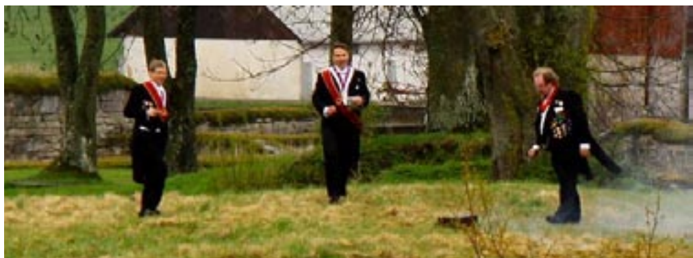
En annan tradition fast nu under strilande regn medan recipienderna stod uppställda med paraplyer i handen. Salut och kanonskott från klosteruinen.