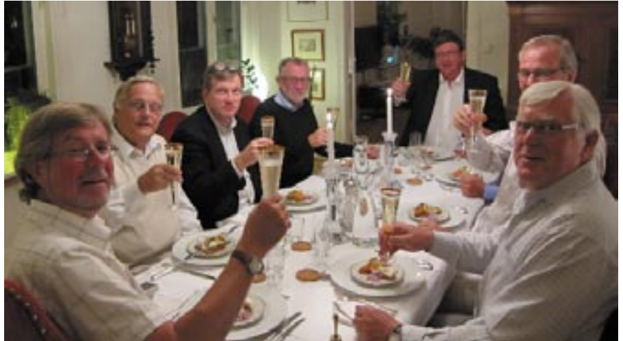
Kanslärer i alla loger, föreningen Eder!

Efter sammanträdet fraktades deltagarna till en plats som inte avslöjats i förväg. Det enda som sagts var att övningen "inte ägde rum ute men knappast heller inne". Bakom denna kryptiska formulering