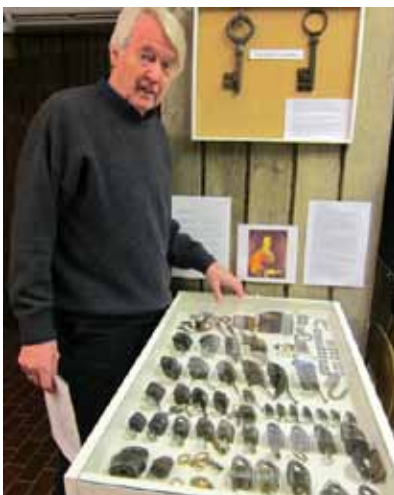
Vid Christopher Polhems lås.