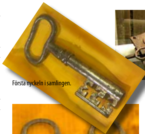
Första nyckeln i samlingen.