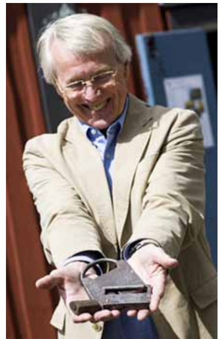
En stolt samlare visar upp en av dyrgriparna.

Han nämner också att svensken Christopher Polhem är hänglåsets fader i Sverige och att hans modell/system användes i hela USA som ett av de förnämsta.