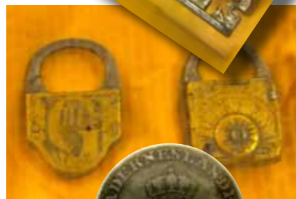
Gustav III:s lås.