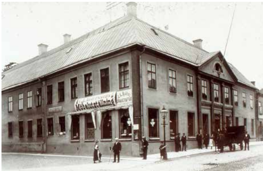
Så här såg Stadshuset vid Hovrättstorget västra sida ut där det låg bakom Ganla Rådhuset. Det var byggt på 1780-talet och brann ned 1965-. Det hade stor pampig entré mot östra Storgatan, till höger i bild och inrymde bland annat restaurang, samlingslokaler och café. Bilden tagen omkring 1900.