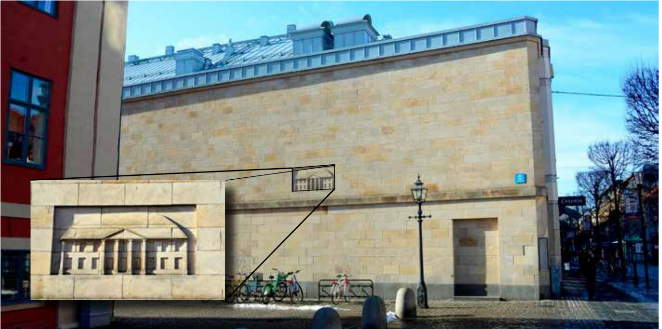
Går man Östra Storgatan västerut på Hovrättstorget och tittar till höger bakom Gamla Rådhuset, ser man tydligt en relief på den i övrigt trista gaveln på Ählenshuset.

1788-1790 flera stora byggnader, som tillsammans med några senare tillbyggnader brann ned 1965. Vem som var byggnadernas arkitekt och vem som var ansvarig byggmästare är okänt. Gatuhuset bestod av två våningar. Fasaden var slätputsad och hade enkla fönsteromfattningar. Huset täcktes, liksom även gårdslängorna utmed Torget, av ett högt, brutet tak med tegel.