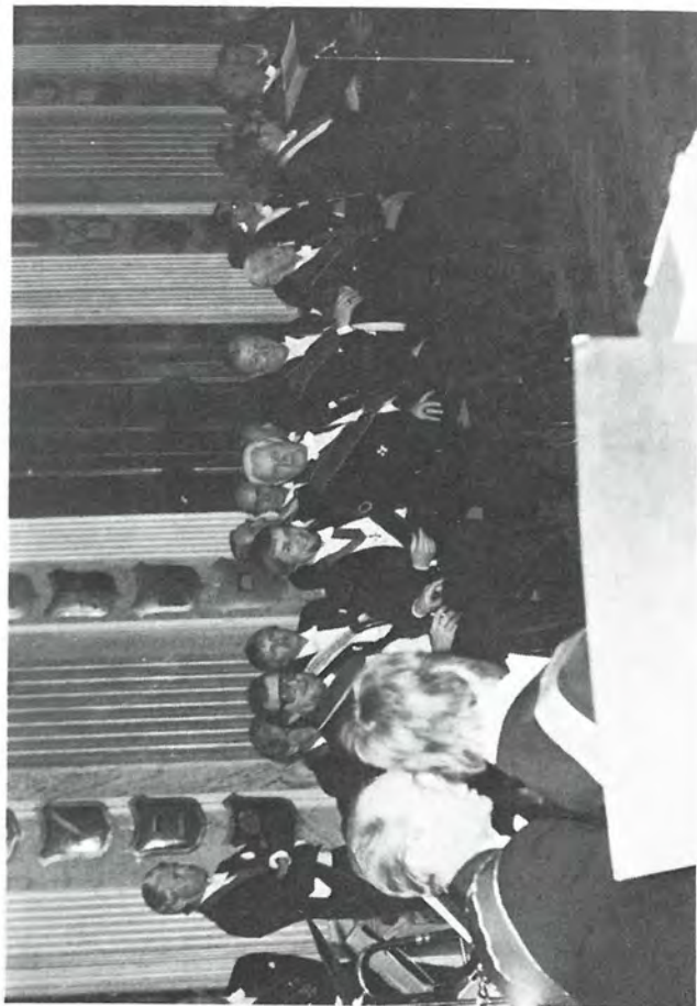
Jönköpings P.B:s sångkör 1977.