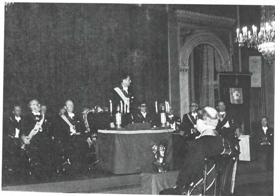
Från installationen av nya Styrande, 12 december, 1970.