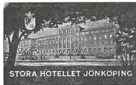
STORA HOTELLET JÖNKÖPING