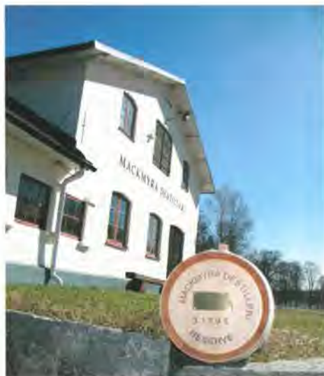
Mackmyra destilleri är ett läskande utflyktsmål?

Under året har Traktörerna haft olika engagemang vid olika Kapitel. Vi har som vanligt tagit hand om våra hitresta gäster, ordnat eftersläckning på kansliet samt haft förmånen att servera råbiff vid Guvernementets årliga träff med Styrande emeriti.