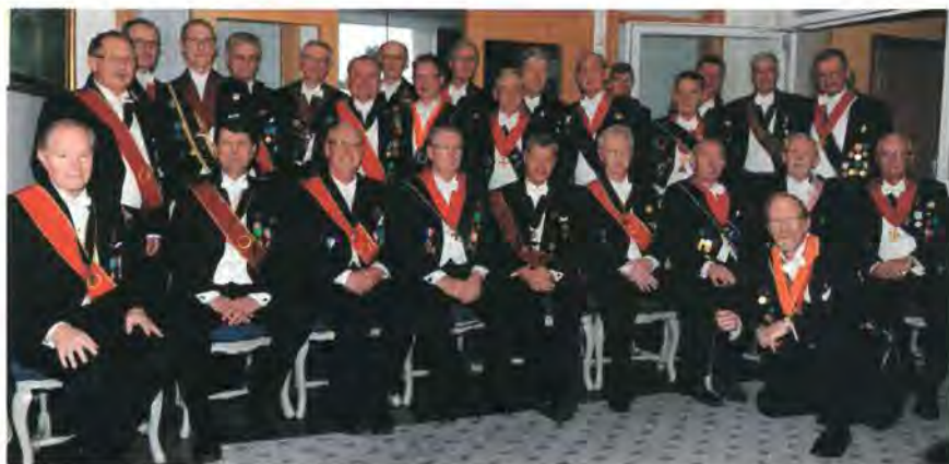
Bacchanaliska kören samlad inför Barbarahögtiden.

Körens årsmöte hölls 1 feb 2010. Ett extra föreningsmöte hölls 19 april 2010, då det beslöts om ändring av principen för måltidssubventioner.