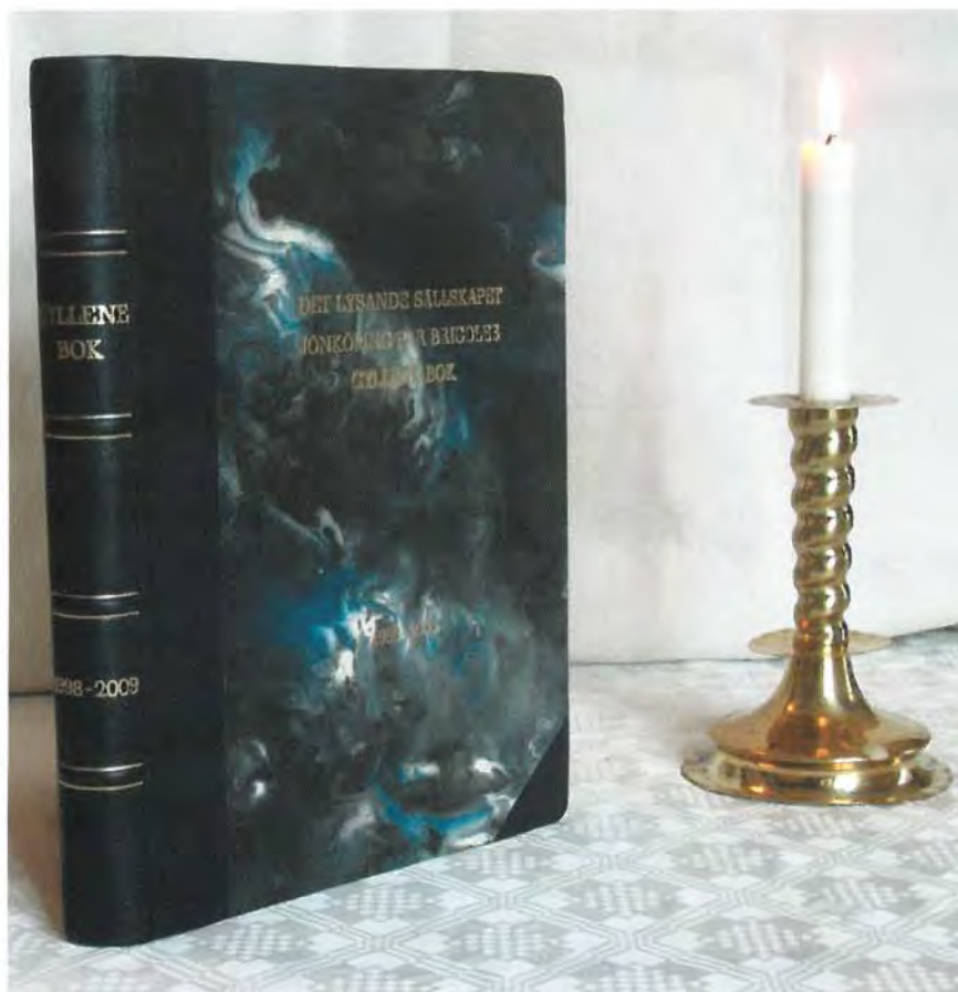
Nutida ljus över pärmagda dätida händelser.

Så tag nu mot vår Gyllne Bok; den är då inte lort Men läsa får ni göra i kopiorna vi gjort! – Mycket nöje!