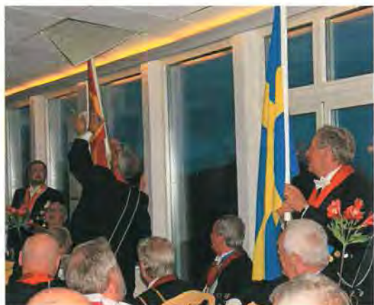
I PB vill vi ha högt i taket!