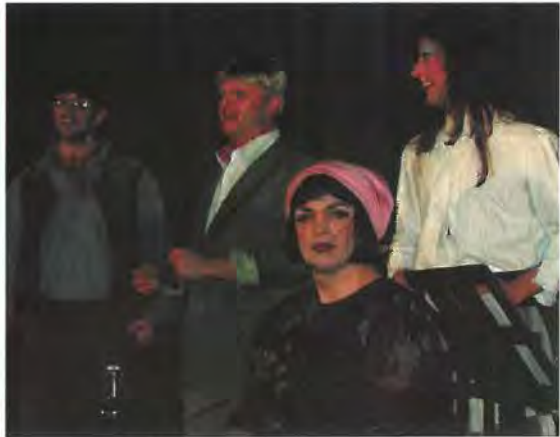
Singoalla och Co.