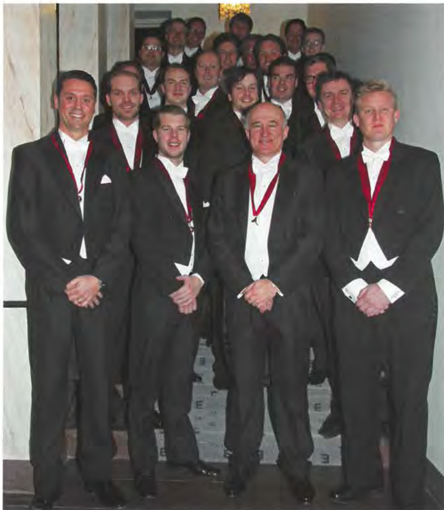
Årets Recipiender hoppas att graden snart skall trappas upp.