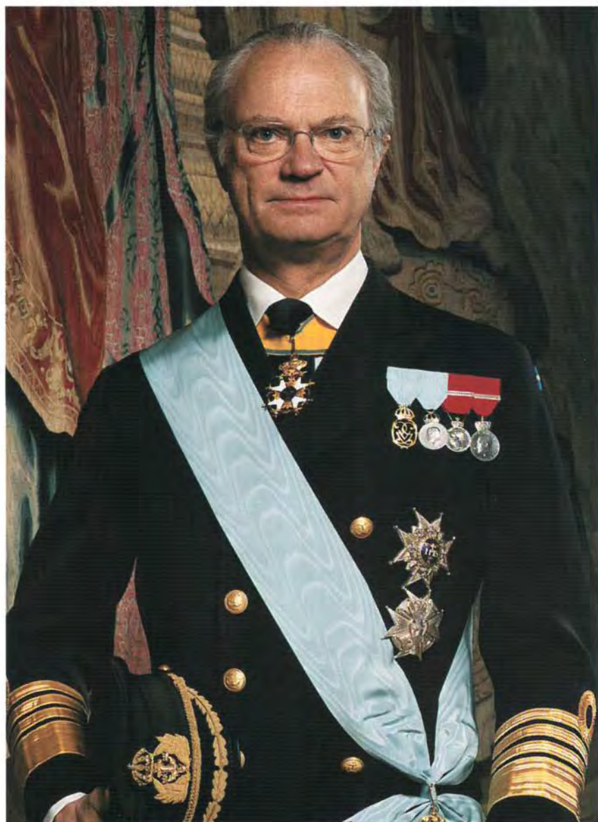
Sällskapets Høge Beskyddare HANS MAJESTÄT KONUNG CARL XVI GUSTAF