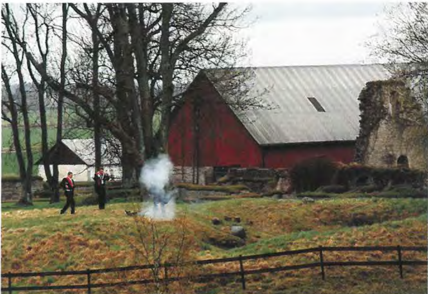
Torrt krut vid våt salut!