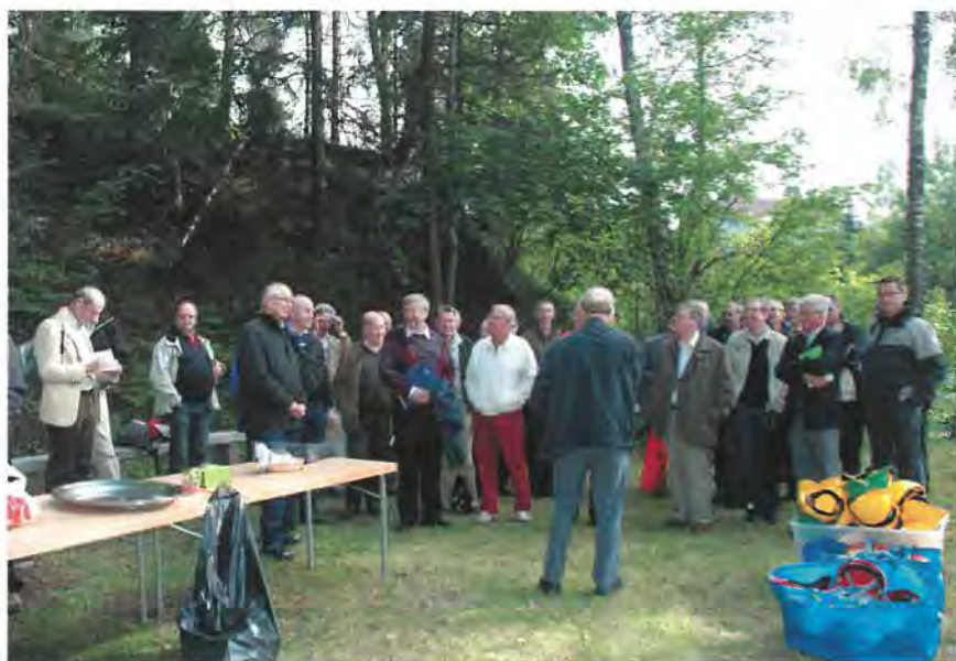
PB-körerna från Vänersborg och Jönköping ses i dagens ljus!