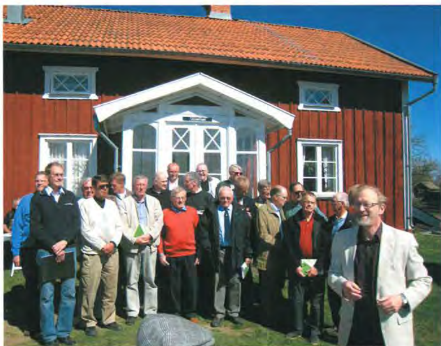
"Ut till landet ut till foglarna". Varje första maj håller PB-kören en bejublade konsert i Åsens by.

Utanför Sällskapet har kören medverkat vid flera tillfällen: