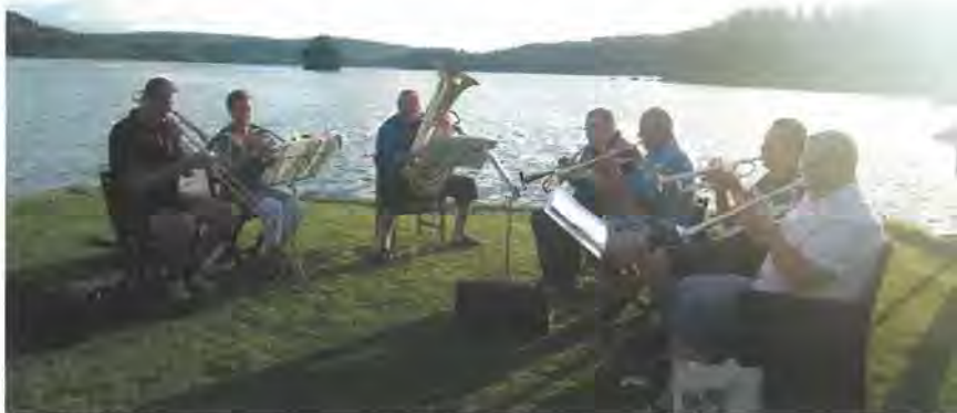
Bacchanaliska musiken på träningsläger i pastoral miljö.

Vid övriga Kapitel har repertoaren varierat, för att kulminera vid Barbarahögtiden med både kända och nyinstuderade musikstycken, allt till Brödernas förnöjelse.