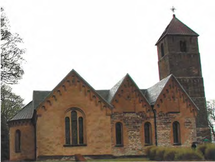
Heda kyrka räddade Bröderna från dagens klimatproblem.