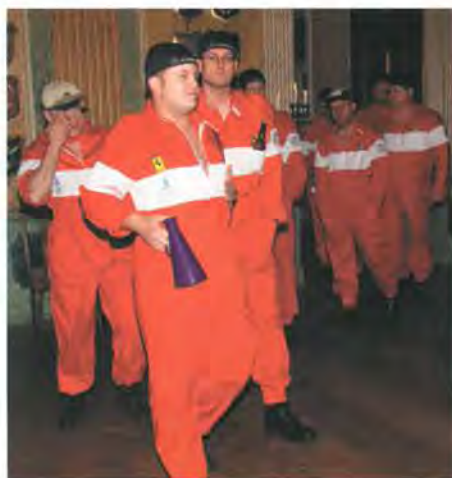
Dags för rannsaking.