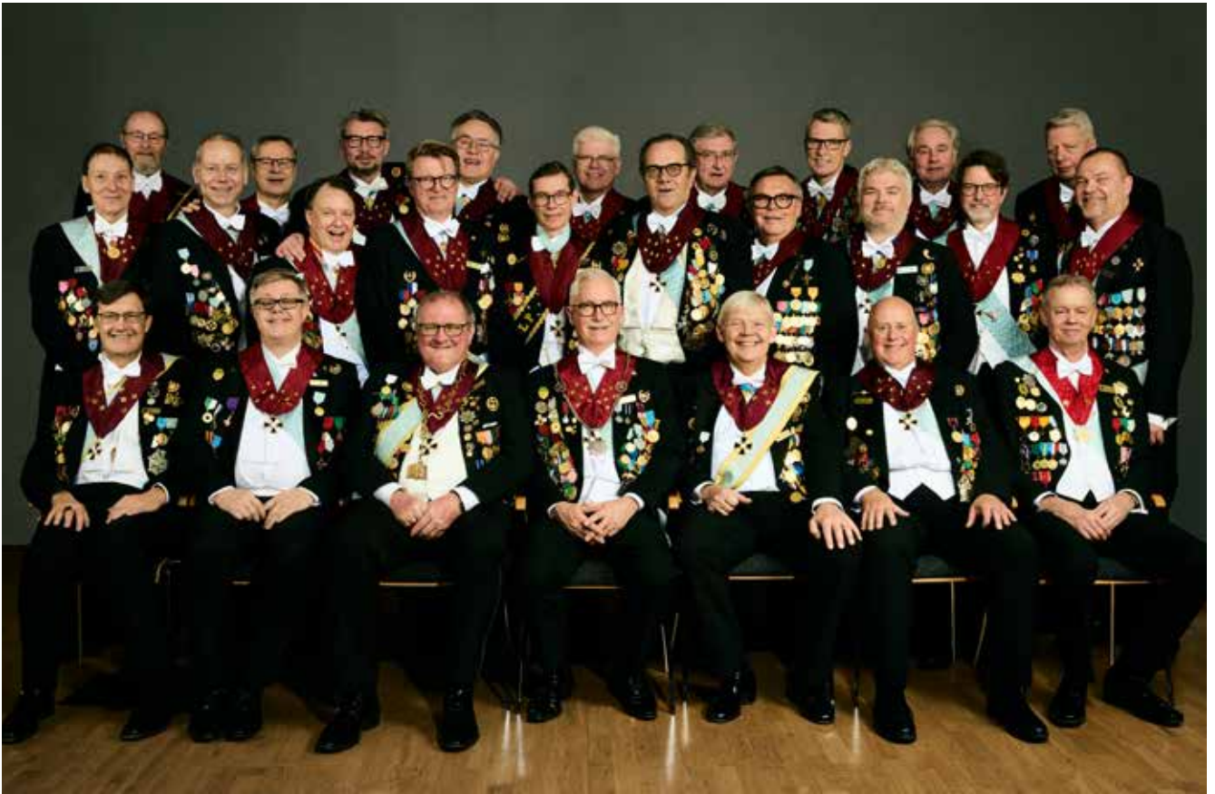
Samtliga logers styrande inom Par Bricolle samlade på en bild. Inte ofta det händer. Det ska till en installation av stora mått för det.

Lördagen den 1 februari satte vi ett svårslaget rekord när över 260 Bröder bänkade sig i Spegelsalen för Grad II och installation. Det blev en formidabel succé med högtidlig installation varvat med vacker körsång, musik och spexinslag av våra teaterbröder. Spegelsalen var vacker smyckad med sköldar och rekvisita av intendenterna.