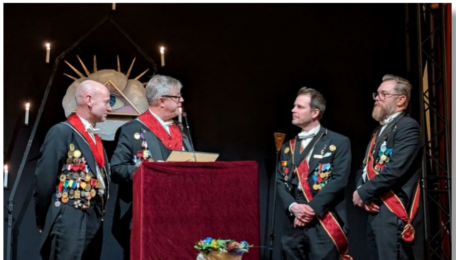
Theatern en värdig stipendiat

De glada överraskningarna fortsatte sedan denna kväll med utdelande av det Traneforska stipendiet till den Bacchanaliska Theatern.