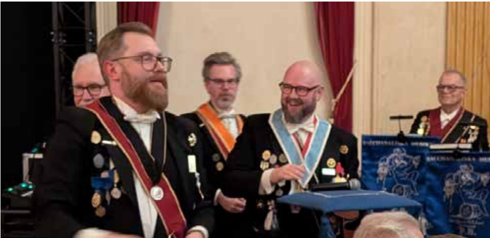
Musikdirektören redo att dela ut Mikro-fänen